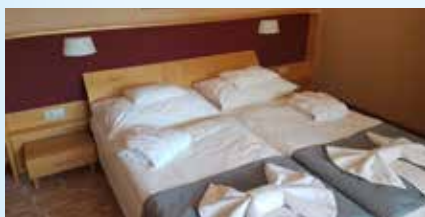
Classic dvoulůžkový pokoj os./pobyt